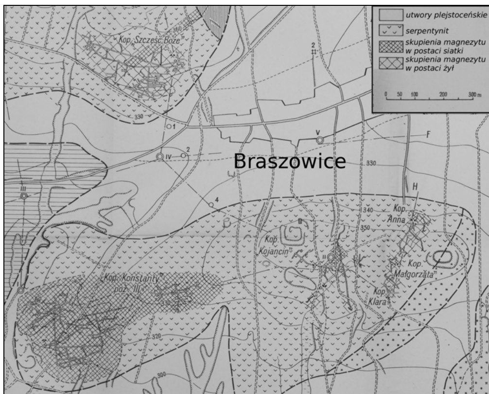
Ryc. 1. Lokalizacja kopalń działających po II wojnie światowej koło Braszowic (Osika, 1955)

Rollschacht i Josef Schacht (Jäkel, 1940). Po 1945 r. na wzgórzu Bukowczyk uruchomiono wydobywanie lub prowadzono prace przygotowawcze na terenie pięciu kopalń, którym nadano polskie nazwy: „Konstanty”, „Kojancin”, „Klara”, „Małgorzata” i „Anna” (ryc. 1) (Osika, 1955; Osika & Gajewski, 1979; Krzyżanowski & Wójcik, 2009, 2010). Największa z nich, podziemna kopalnia Konstanty, zachowała się częściowo, pomimo prowadzenia na niej eksploatacji odkrywkowej do współczesnych czasów i w ostatnich latach była wielokrotnie dokładnie opisywana w literaturze (np. Krzyżanowski & Wójcik, 2009). Pozostałe trzy kopalnie uznawane były za niedostępne.