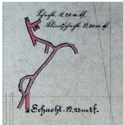
Ryc. 2. Kopalnia magnezytu Sindermana w swojej początkowym stadium rozwoju na planie z 1882 r. (Jäschke, 1882).

Kolejne informacje o górnictwie na omawianym terenie uzyskujemy z archiwalnej mapy założonej w listopadzie 1897 roku w Wałbrzychu ( Waldenburg ) przez mierniczego A. Manna. Przedstawia ona południową część gruntów wsi Braszowice i położone w tym rejonie kopalnie magnezytu (Sroga i in., 1998). Podobnie jak wcześniejsze arkusze, mapa obejmuje teren w okolicy szybu późniejszej kopalni „Anna”, przez tereny powojennych kopalni „Małgorzata”, „Klara” i „Kojancin”, aż do terenów tzw. „starych zrobów” między „Kojancinem” a „Konstantym” (nazwy powojenne). Pod sygnaturą mapy mierniczy Mann powołuje się na plany sporządzone 15 lat wcześniej przez Jäschkego i zastrzega, że granice własności gruntów oraz poszczególnych wyrobisk górniczych przyjął w jego ujęciu, bez dokonywania nowych pomiarów. Dokument był na bieżąco aktualizowany w latach 1898–1925, aczkolwiek ostatnich uzupełnień dokonano 14 i 15 października 1937 r (Mann, 1897).