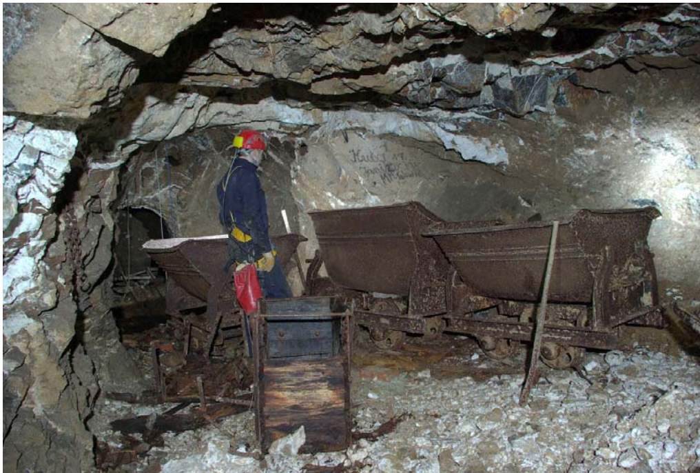
Ryc. 6. Fragment chodnika na poz. II, z zachowanymi wagonikami górniczymi i skrzyniami do przenoszenia urobku

Aktualny przebieg i zasięg chodników na poziomie II kopalni w znacznym stopniu odpowiada planowi tego poziomu autorstwa R. Osiki (1955). Występują jednak pewne niezgodności. Autor ten podaje, że kopalnia „Anna” jest udostępniona przez szyb i wyrobiska na dwu poziomach. Jest to o tyle ciekawa informacja, iż eksploracja kopalni w latach 2008–2009 wykazała, że znajdują się tu co najmniej trzy poziomy. R. Osika pisze, że „ poziom I (na głębokości ok. 20 m – dop. autorów) jest odbudowany i niedostępny ” (Osika, 1955, s. 23). Rzeczywiście, na tym poziomie stwierdzono współcześnie jedynie dwa krótkie korytarze odchodzące od szybu. Poziom II, dokładnie skartowany przez R. Osikę, położony jest na głębokości 35 m (ryc. 6 i 7). Nie jest dziś jasne, dlaczego autor ten nie wspomina o poziomie III, położonym 10 metrów niżej, który obecnie jest dostępny. Być może w czasie badań prowadzonych po II wojnie światowej poziom ten był całkowicie zalany lub niedostępny z powodu zawału udrożnionego w późniejszym okresie, ewentualnie nie przewidywano jego eksploatacji.