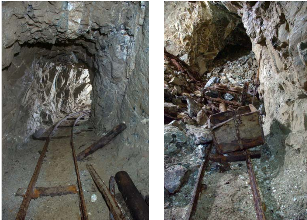
Ryc. 7 i 8. Fragment południowej części chodnika na poz. II, z dobrze zachowanymi torami i zniszczonym wagonikiem

W porównaniu z planem R. Osiki opublikowanym w 1955 r. w kilku miejscach znajduje się w rzeczywistości nieco więcej chodników, co przypuszczalnie oznacza, że plan wykonano przed ostatnimi pracami poszukiwawczymi w kopalni. Jedno z takich miejsc oznaczyliśmy literą „B” na ryc. 5. W kierunku południowym wznosi się tu krótki chodnik, w którym za tamą zgromadzono skałę płoną. Tuż przed tamą, odchodzi stromo w dół mała pochylnia, którą można zsunąć się kilkanaście metrów w kierunku III poziomu. Na planie R. Osiki nie naniesiono także szybu o maksymalnej szerokości ok. 4 metrów (oznaczony literą „C” na ryc. 5), wzdłuż którego prowadziły niegdyś uchwyty i drabiny (jedna z nich zachowała się w jego najniższej części). Kilkanaście metrów nad spągiem zaczyna się drewniana obudowa szybu, istniejąca aż do wysokości kilkunastu metrów. Pod szyb doprowadzono tory kolejki, prawdopodobnie było to zatem miejsce zsypu urobku z wyższego poziomu, który został spenetrowany w 2009 roku. Około 12 metrów ponad dnem szybu zlokalizowany jest krótki poziom wydobywczy (ok. 40 metrów) i kilka zasypanych chodników. Znajduje się tu także wagonik górniczy podobny do tych stojących przy szybie głównym na poziomie II.