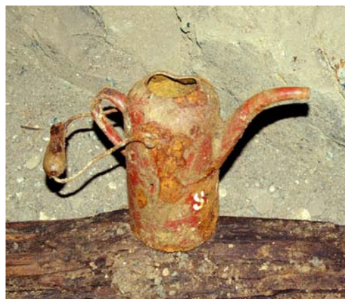
Ryc. 9 i 10. Pozostałości odnalezione w kopalni: ładunek donaritu z oznaczeniem „1944” oraz przedwojenna olejarka